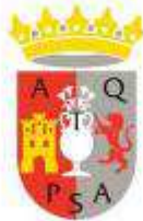
Ayuntamiento de Antequera